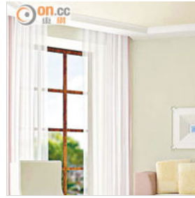
改變不了地點、坐向等，不少人相信室內設計配合風水布局，可改善居住的環境。