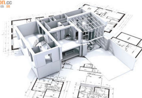
社會的住屋需求有增無減，而人們對風水愈來愈感興趣，吸引不少建築界人士進修風水知識，為事業增值。