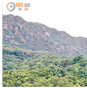
一般人認為背山面海的房子風水好，在初級證書課程中，就會教授山向飛星4種格局。