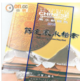
課程會提供風水教材供學員參考。